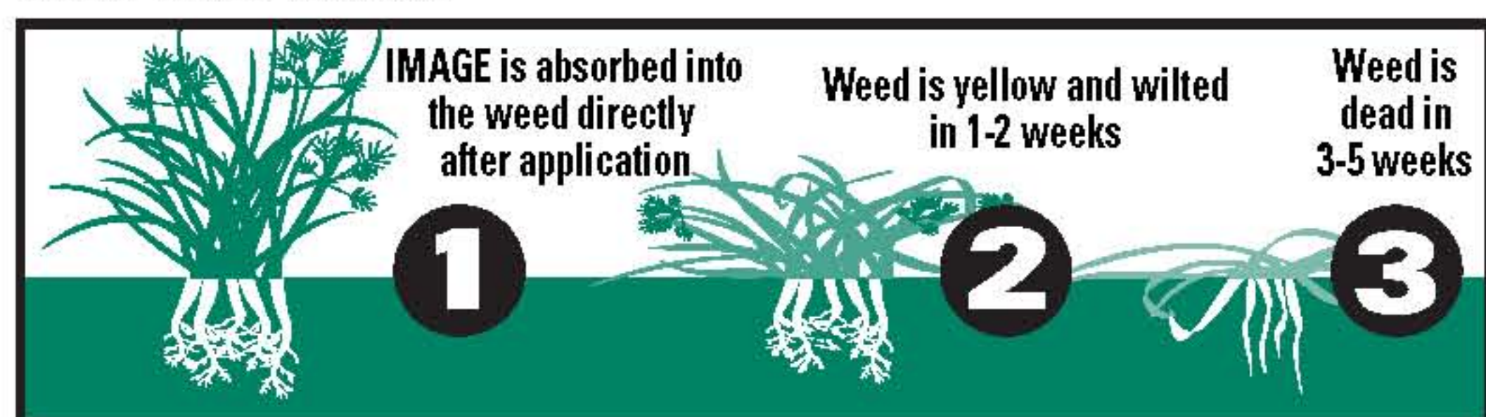
IMAGE Consumer Concentrate selectively kills tough weeds like purple and yellow nutsedge , wild onion and garlic, dollarweed, annual bluegrass, and others as listed. It can be used to kill weeds in bermudagrass, St. Augustinegrass, buffalograss, centipedegrass, or zoysiagrass lawn and also in certain landscape ornamentals and groundcovers (see CONTROL OF WEEDS IN ORNAMENTALS). IMAGE is mainly absorbed by the roots of sprayed weeds and is translocated throughout the weed to provide complete kill. Complete kill should occur in 3-5 weeks.